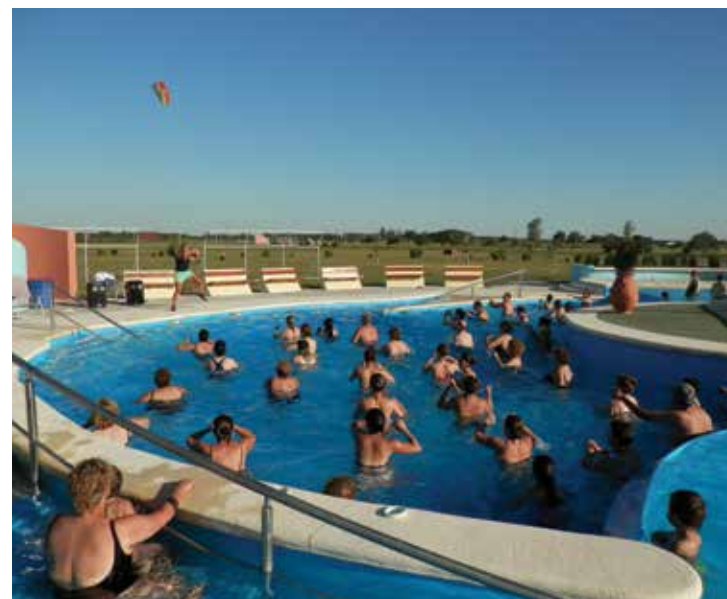
Enfrente: una imagen de las Termas de Gualeguaychú. Arriba, una clase de aquagym en Basavilbaso y una postal de la tranquilidad del complejo de San José. Abajo: las Termas de Villa Elisa. En la página 24, las termas de La Paz y del Guaychú.

El complejo termal está ubicado sobre las barrancas con vista al río Paraná. El alto contenido de sulfatos, calcio, cloruros, magnesio y estroncio de sus aguas saladas –surgentes a una temperatura de casi 42°– de origen marino brindan una intensa acción farmacológica. El