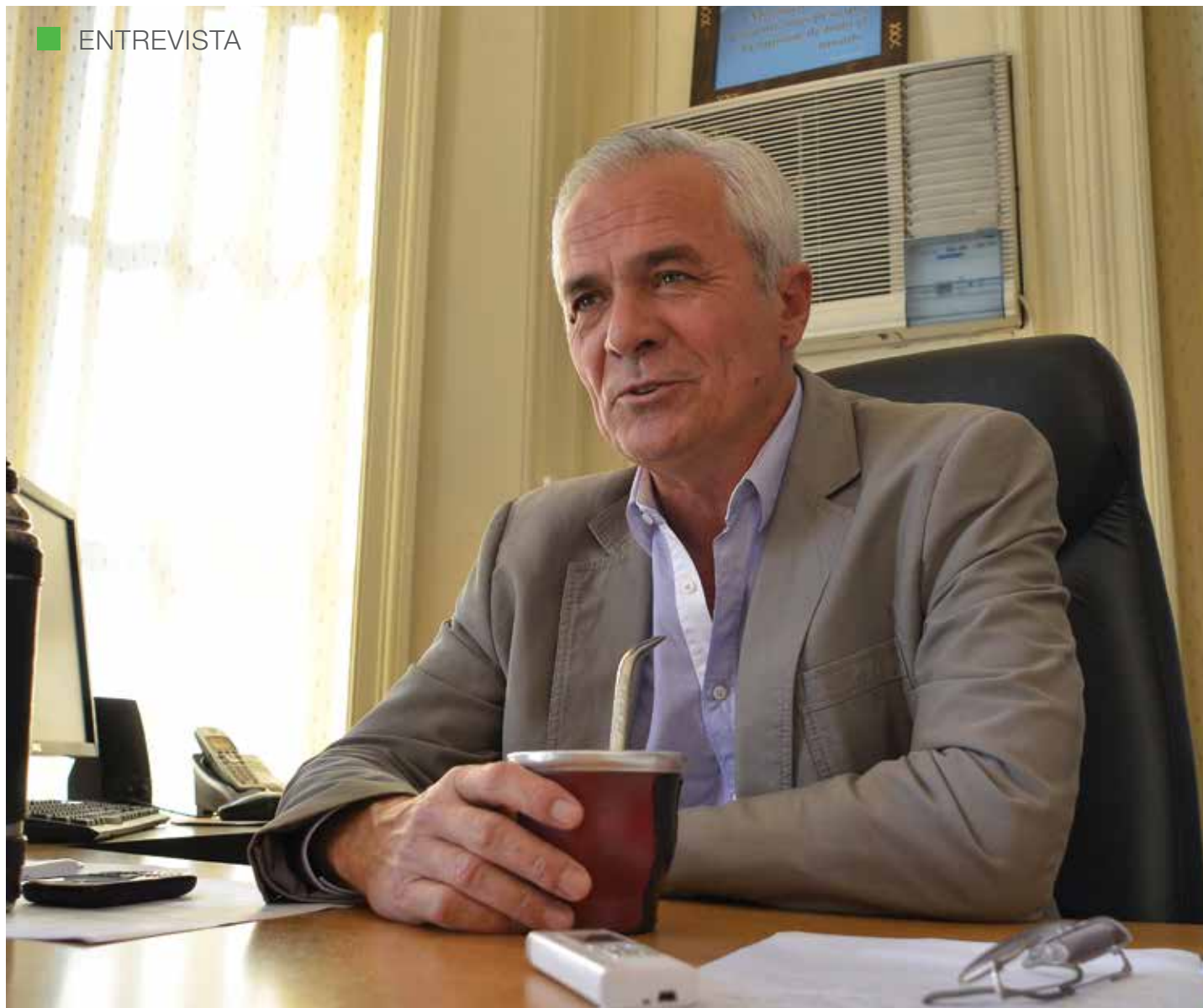
MINISTRO HUGO MARSÓ