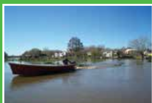
ATRATIVOS Vacaciones con balance positivo