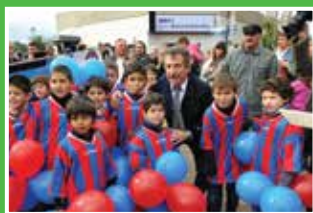
APOYO AL DEPORTE Más fondos a los clubes