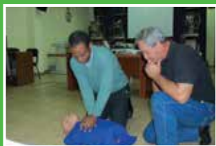
CONOCIENDO EL IAFAS Servicio de Medicina Laboral