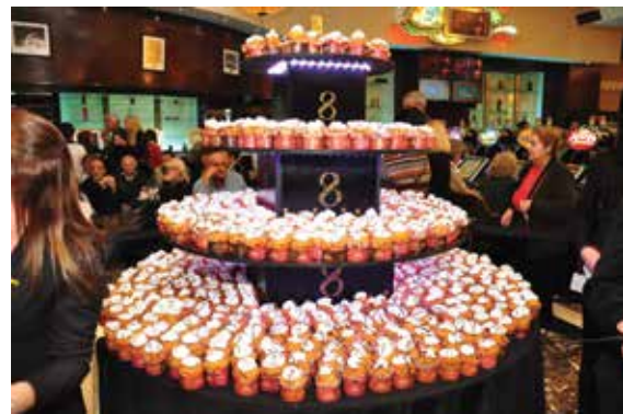
Casino Victoria celebró junto a sus clientes un nuevo aniversario, con shows en sala, brindis, tortas y el sorteo de un Peugeot 208 0 km.