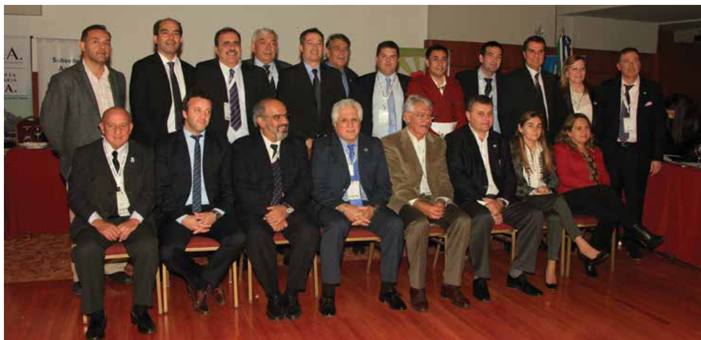
Los integrantes de la nueva Junta Directiva y la Sindicatura Colegiada de la Asociación de Loterías, Quinielas y Casinos Estatales de Argentina para el bienio 2014-2015 posaron para los flashes.