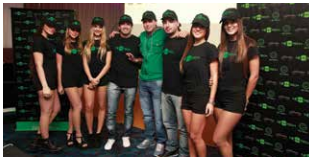
Los ganadores del primer Torneo de Póker versión Texas Holdem por tablet on-line , que se disputó en junio en el Casino Neo Mayorazgo de Paraná.

El torneo comenzó el lunes 2 de junio con las instancias de capacitación; el martes 3 y miércoles 4 fueron las primeras rondas, en tanto que el miércoles 11 de junio tuvieron lugar las semifinales y la final. En esa velada definitiva, a la que fueron invitados todos los participantes del torneo y sus acompañantes, se realizó la entrega de premios y un festejo con sorteos y música en vivo. ■