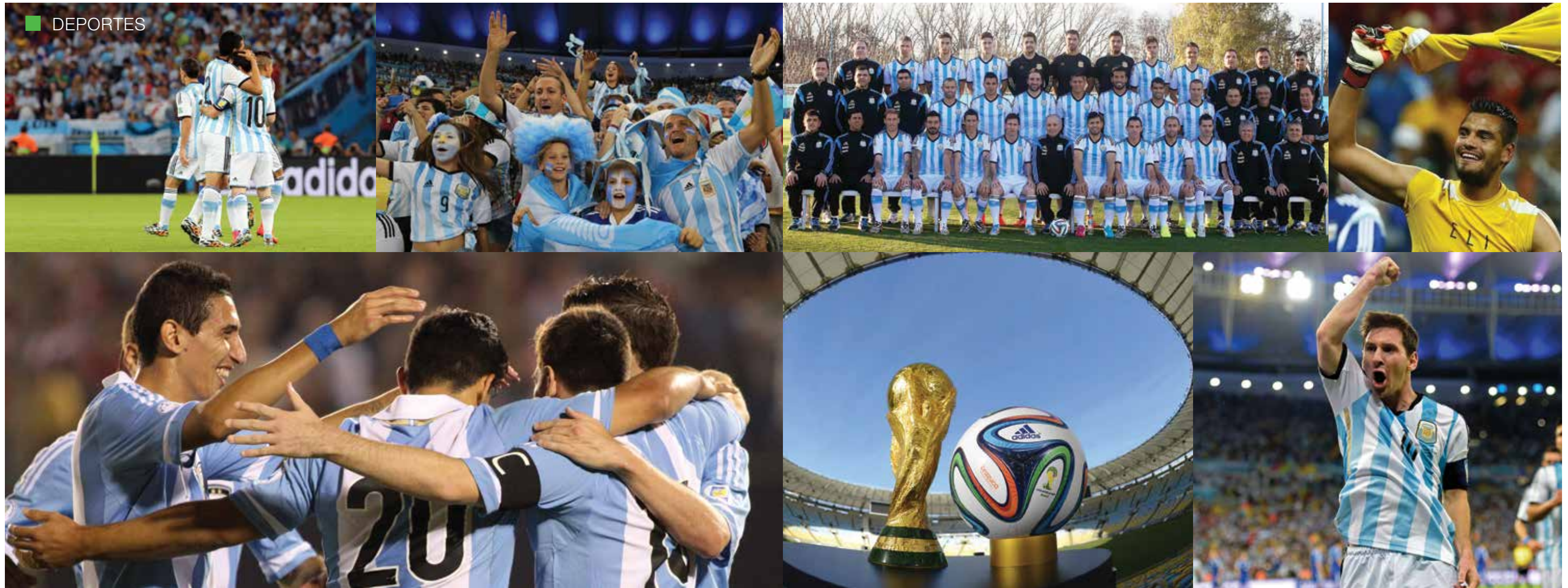
ADRIÁN BRODSKY EN LA COPA DEL MUNDO 2014