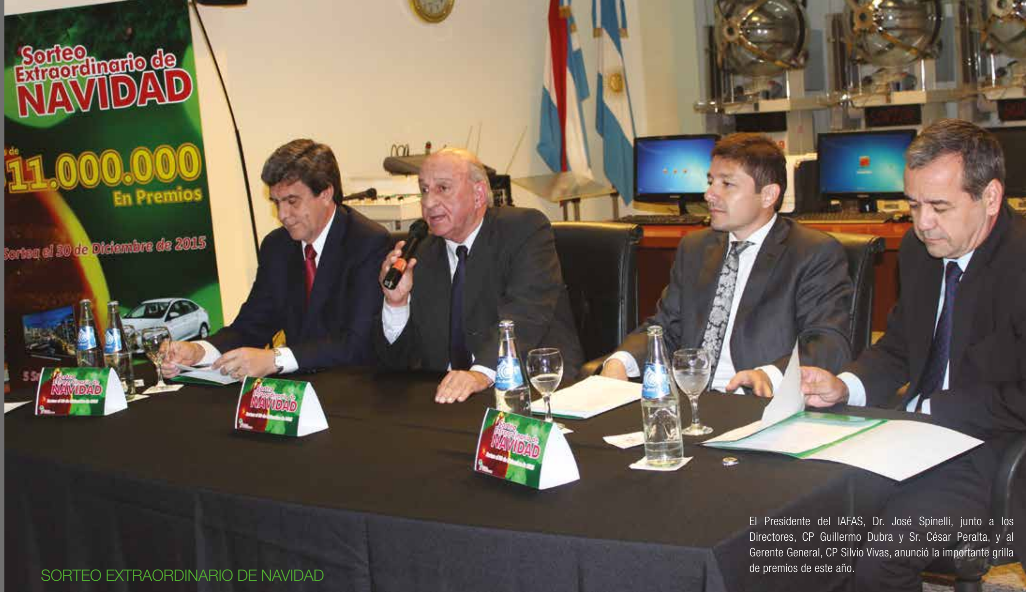
SORTEO EXTRAORDINARIO DE NAVIDAD