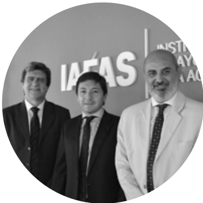
DIRECTORIO - IAFAS

Ganar la Copa Mundial de Fútbol fue hecho que nos convocó a la mayoría de los argentinos en torno a recuerdos, emociones, ilusiones y alegrías... Cada uno sabe qué sintió en cada uno de los siete partidos y cómo reaccionó cuando escuchó el pitazo final el 18 de diciembre y se supo Campeón del Mundo.