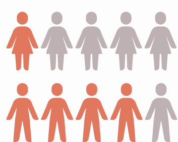
Total de autoexclusiones 1.8%